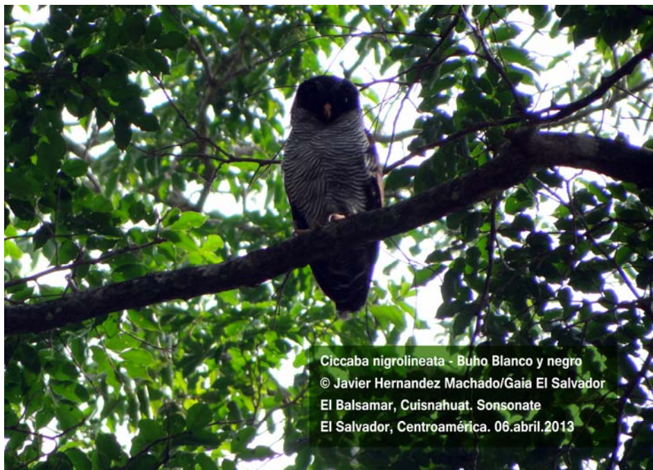
Ciccaba nigrolineata - Buho Blanco y negro El Balsamar, Cuisnahuat. Sonsonate El Salvador, Centroamérica. 06.abril.2013