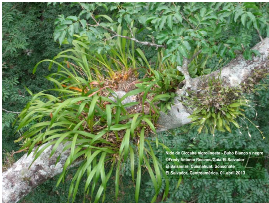
Nido de Ciccaba nigrolineata - Buho Blanco y negro El Balsamar, Cuisnahuat. Sonsonate El Salvador, Centroamérica. 01.abril.2013